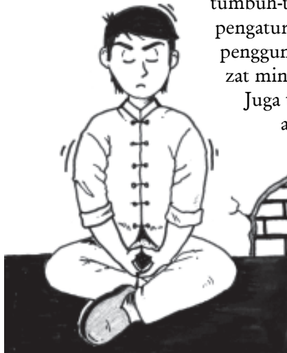
‘Terapi Penunjang’ dari Spiritia.

Yang termasuk terapi penunjang antara lain adalah penggunaan ramuan tradisional, tumbuh-tumbuhan, jamu-jamuan, pengaturan gizi pada makanan, dan penggunaan vitamin serta suplemen zat mineral.