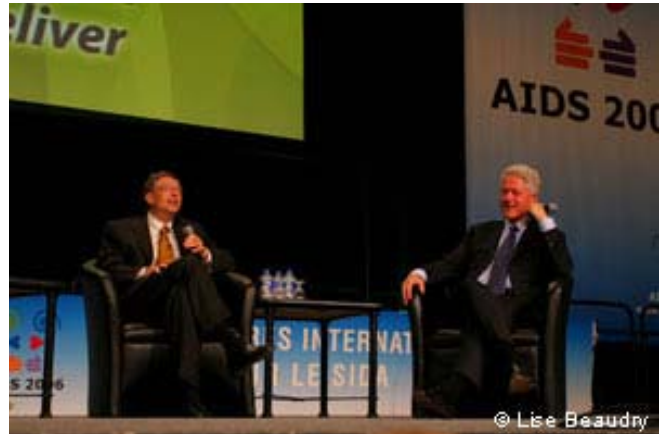
Bill Gates dan Presiden Bill Clinton dalam International AIDS Conference di Toronto

Juli 2006, pil pertama yang dipakai sebagai satu pil sekali sehari untuk mengobati infeksi HIV secara efektif disetujui untuk dijual di AS. Hasil dari kerja sama antara dua perusahaan obat besar yang selama ini belum pernah terjadi, pil Atripla, gabungan tiga jenis obat yang dipakai secara luas pada pengobatan lini pertama. Obat baru sekali sehari menunjukkan pengembangan yang cepat sejak pertengahan 1990-an, waktu Odha umumnya harus memakai beberapa pil setiap beberapa jam.