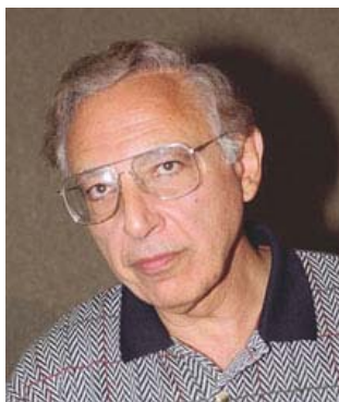
Dr. Robert Gallo

Pada September pengunduran diri presiden Afrika Selatan Thabo Mbeki disambut sebagai kemungkinan titik balik pada kontroversi tentang tanggapan pemerintah Afrika Selatan pada HIV dan AIDS. Penelitian Harvard yang diterbitkan tak lama setelah dinyatakan bahwa lebih dari 330.000 meninggal antara 2000 dan 2005 sebagai akibat langsung dari kegagalan pemerintah Afrika Selatan menyediakan ARV. Keputusan sementara presiden Kgalema Motlanthe agar segera mengangkat menteri kesehatan baru, Barbara Hogan, dirayakan oleh para aktivis AIDS sebagai tanda komitmen baru pada AIDS.