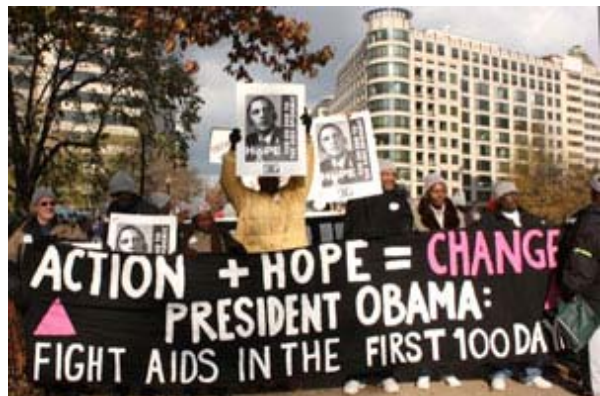
Arak-arakan “100 hari untuk melawan AIDS” di Washington D.C., AS

Artikel asli: 2006 History , 2007- History