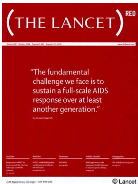
Lancet edisi MERAH, Agustus 2006

Manto Tshabalala-Msimang, dengan tuduhan "kebijakan HIV/AIDS yang berbahaya, kebohongan ilmiah." Sebagai gantinya, pemerintah Afrika Selatan membentuk komite baru antarmenteri untuk mengambil alih tanggapan AIDS nasional. Komite itu akan dipimpin oleh wakil presiden, dengan demikian akan mengesampingkan kebijakan menteri kesehatan yang kontroversial.