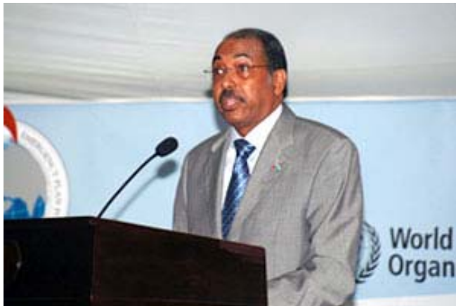
Michel Sidibé, Direktur Eksekutif UNAIDS

Pernyataan Swiss segera dihadapkan pada perdebatan, dengan pertanyaan mengenai keandalan kesimpulan yang diajukan oleh kelompok advokasi HIV/AIDS. Keprihatinan berpusat pada kenyataan bahwa penelitian itu hanya didasarkan pada pasangan heteroseksual dan oleh karenanya lalai untuk melibatkan seks dubur. UNAIDS dan WHO segera mengeluarkan pernyataan yang menegaskan bahwa penggunaan kondom secara konsisten tetap merupakan cara perlindungan teraman terhadap HIV.